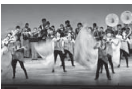
昨年のセレモニー(左)、更生保護大会(右)の様子