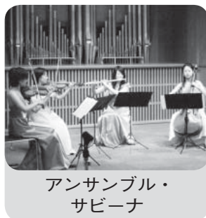
アンサンブル・ サビーナ

と解説で聴くコンサートで す。 とき 9月20日(土)午後 2時～3時30分 ところ ゆうゆうセンター4 階 多目的ホール 出演者 ▽演奏Ⅱアンサンブル・サ ビーナ(演奏曲目は「風と 共に去りぬ」よりタラの テーマ、「サウンド・オブ・ ミュージック」など)