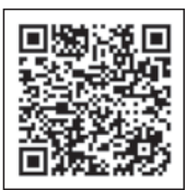
おおさか防災 ネットQRコード

ig.jp/shobobosai/training- top/) 問い合わせ 府民お問合せセ ンター(TEL 06-6910- 8001) ■交野市訓練用エリアメ ール・緊急速報メール 実施時間 午前11時30分～ 問い合わせ 地域安心課 ※NTTドコモ、au、ソフト バンクの携帯電話が対象で す。受信できない携帯電話 があるため、対応機種や受 信の設定は、携帯電話各社 にお問い合わせください。