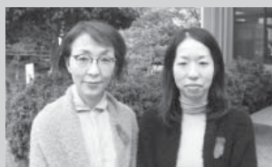
障がい者相談支援センター明星 (私市2-14-14、TEL 891・3636)

基幹相談支援センターでは、地域の相談支援の拠点として、総合的な相談業務を行うほか、相談支援専門員の人材育成や、自立支援協議会の運営を通じて、障がい者がいきいきと安心して暮らせる地域づくりを旨としています。