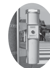
「視覚障害者用押ボタン」

12月24日(水)大阪ガス(株)から、市内の障がい者施設に、毎年恒例のクリスマスケーキのプレゼントがありました。施設のみなさんは、手作りのメッセージカードを手渡し、お礼の気持ちを伝えました。