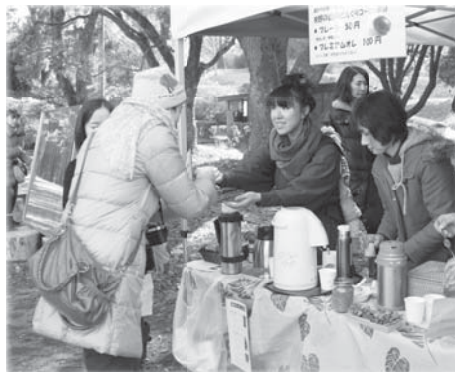
おりひめ大学ブース