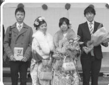
新成人代表のみなさん

1月12日(祝)星の里いわふねで、成人式が行われました。市内の新成人は、915人(男性460人、女性455人)です。