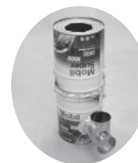
ロケットストーブ

缶と土などで作る暖房設備。燃焼効率が高く、従来のストーブより少ない薪の量で暖をとることができる。煙もほとんど発生させず、化石燃料も使用しないため、「エコストーブ」とも呼ばれている。