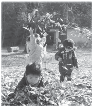
落ち葉のじゅうたん

12月23日(祝)かたのキャンバス2014が、大阪市立大学理学部附属植物園で行われ、約5,000人が訪れました。来場者は、森の中でのアート作品との出会いや、楽器を演奏しながら歩く「森もりパレード」、夜のクリスマスツリーライトアップなどを楽しみました。また、おりひめ大学ブースでは、各学科の大学生が交野産の食材を使った粕汁やどんぐりコーヒー、摂南大学の学生も参加して焼き立てのナンとカレーを提供しました。