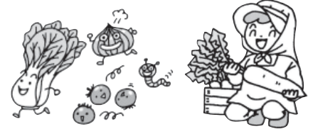
市民農園の募集一覧