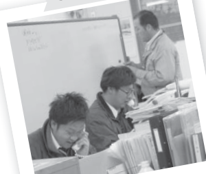
電話対応をしているところだね