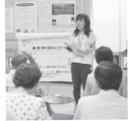
市民健診の流れを説明しているよ