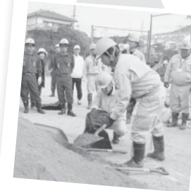
防災訓練で土のう作りを実践しているよ