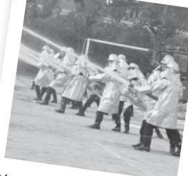
出初式での放水の様子は圧巻だね

市の職員を募集します。募集する職種、受験資格、採用予定人数などは下表のとおりです。各職種とも、国籍・性別は問いません。