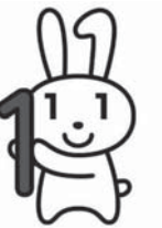
マイナンバーキャラクター「マイナちゃん」

平成27年10月以降に、マイナンバーが記された「通知カード」が、住民票の住所に送付されます。