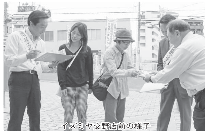
イズミヤ交野店前の様子