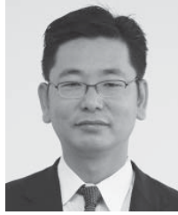
副議長 久保田哲議員