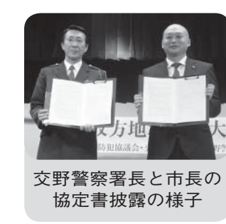
交野警察署長と市長の協定書披露の様子