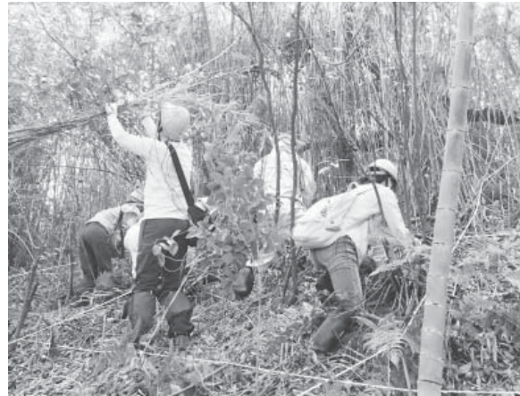
申し込み・問い合わせ 環境衛生課 (TEL 892・0121)