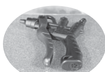
ジョプラスター (エアーダスター)