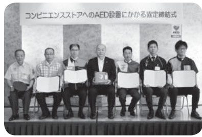
協定締結式の様子

設置店舗 下表のとおり 重篤な傷病者が発生した場合に、救急車が到着するまでの間、その場に居合わせた人（バイスタンダー）による救