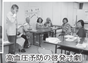
高血圧予防の啓発寸劇