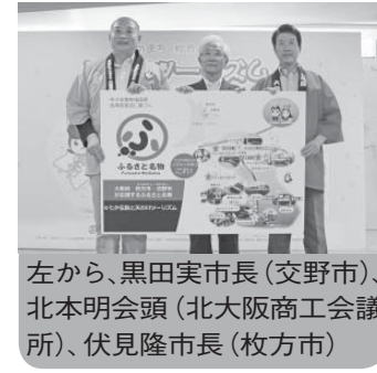
左から、黒田実市長(交野市)、北本明会頭(北大阪商工会議所)、伏見隆市長(枚方市)

◆ふるさと名物応援宣言とは 地域資源を活用した中小企業の事業活動を促進し、地域活性化を図るため、「改正中小企業地域資源活用促進法」に基づき、地域を挙げて「ふるさと名物(地域資源を活用した商品・サービス)」を応援す