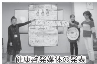
健康啓発媒体の発表

Q. 健康の啓発、って何をしているの? A. 「どうしたら身近に健康を感じてもらえるか」、「楽しく取り組むにはどうすればいいか」などをみんなで話し合いをし、寸劇など工夫を凝らして啓発を行っています。