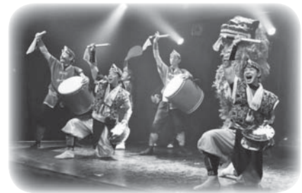
〈創作芸団レキオス〉

1998年結成。沖縄の地域芸能として親しまれてきた獅子舞やエイサーを、曲のアレンジや創作により、新たな舞台スタイルとして確立。