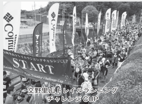
交野里山トレイルランニングチャレンジCUP