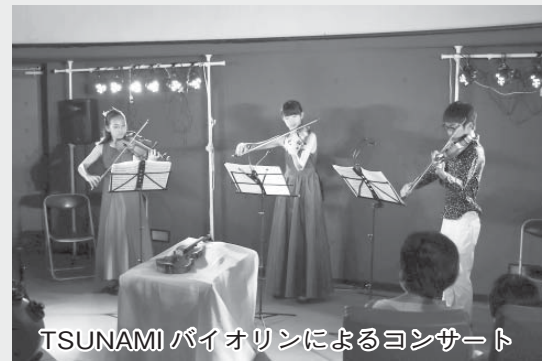
TSUNAMI バイオリンによるコンサート