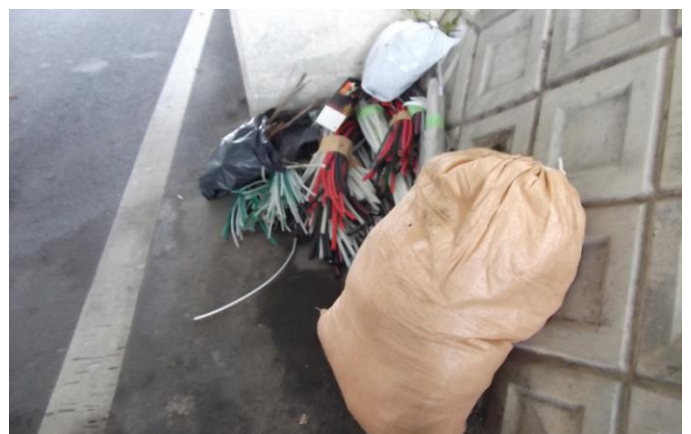
道路上・高架下に不法投棄された廃棄物