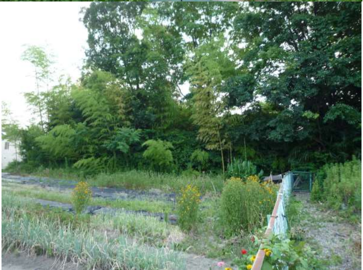
写真3 二郭（私部6丁目1724番 上：南から、下：東から）