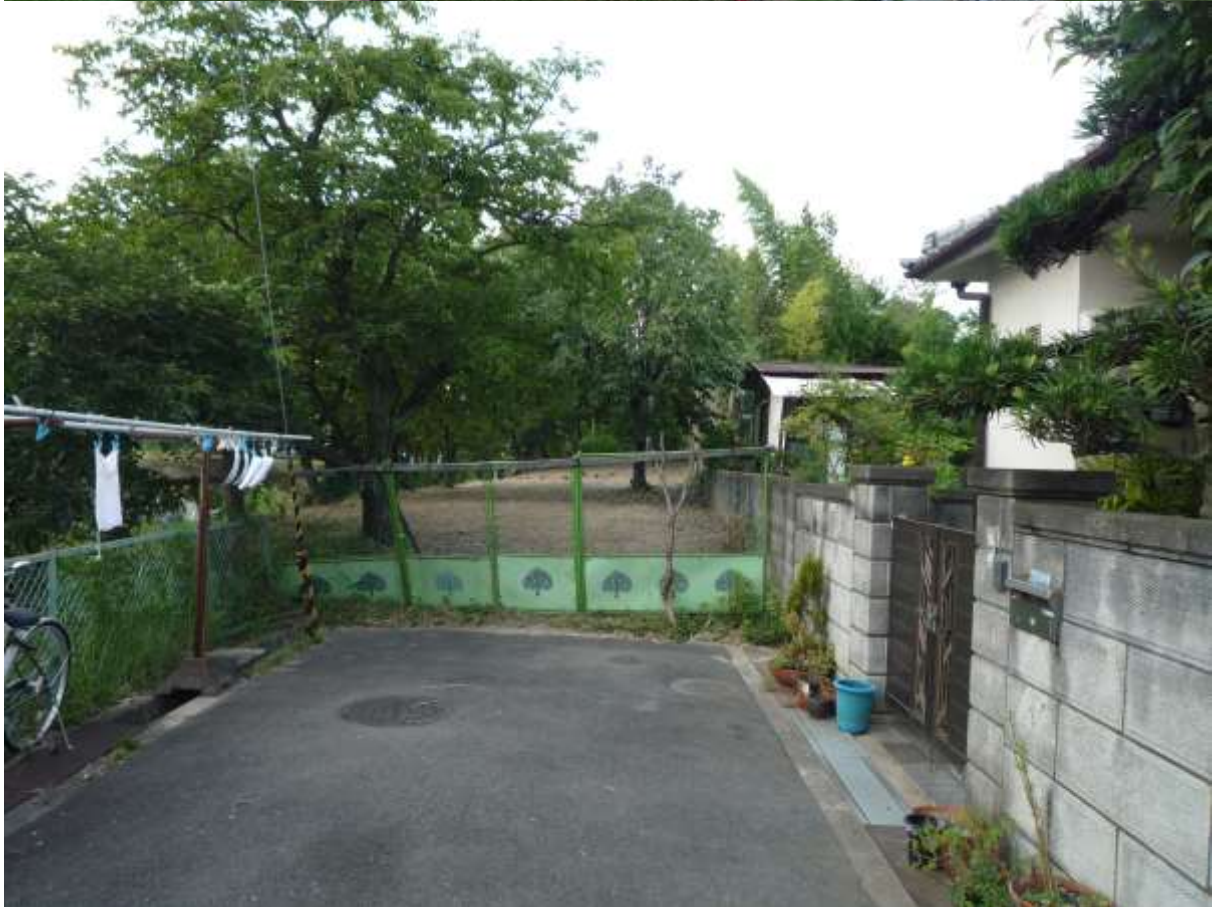
写真1 本郭（私部6丁目1738番、上：全景 西から、下：進入路側から）