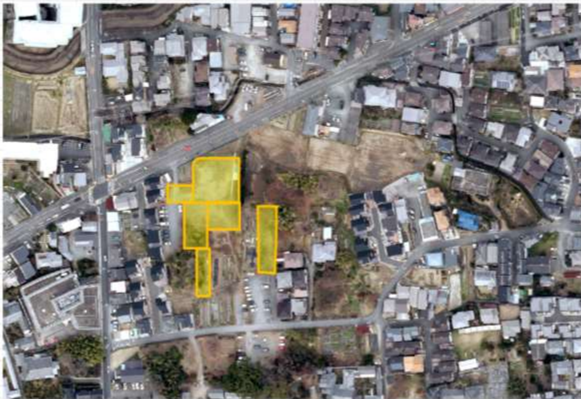
図1 市指定文化財候補地位置図