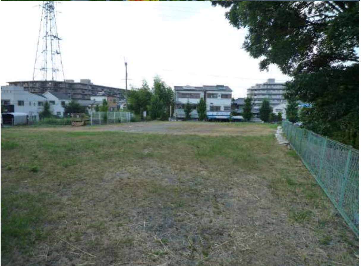
写真2 二郭（私部6丁目1717番,1720番1,1721番,1723番 上：北東から、下：南から）