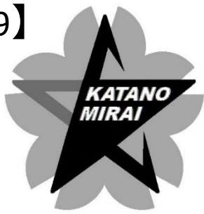
グレースケール版