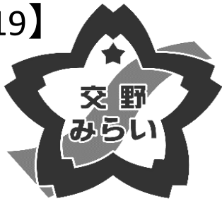
グレースケール版