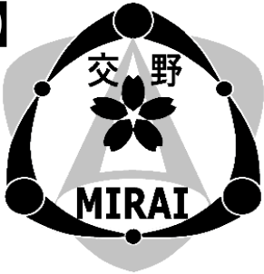
グレースケール版