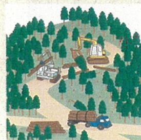
適切に森林整備を推進!

ことから、森林の土地の所有者の把握を進めるため、平成24年4月から森林法に基づく森林の土地の所有者となった旨の届出制度が創設されました。なお、この届出により、森林の土地の所有権の帰属が確定されるものではありません。