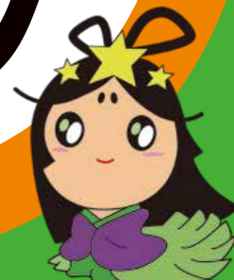
交野市産業PRキャラクター「おりひめちゃん」