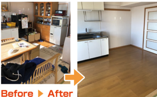
Before ▶ After