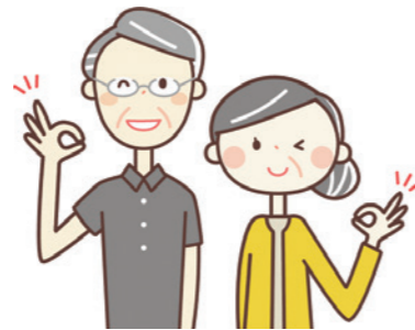
半袖の服や、半袖の服の上にカーディガンなど

「密」をさけるため、 接種会場へは 時間厳守 で お越しください。 ※早く来場しても、 受付できません。