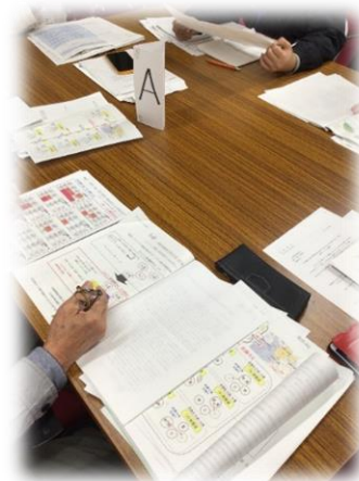
第3回懇談会の様子

そのため、 学校施設が更新の時期を迎えている今、将来にわたって子どもたちに良好な教育環境を確保することのできる学校配置を考えるとともに、計画性をもって学校施設の改修を行っていく必要があると考えています。