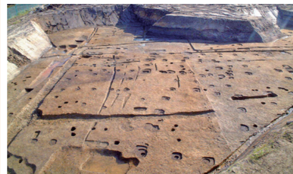
古墳時代の集落2

発掘調査報告書では、5世紀初頭の集落が展開し始める時期から、7世紀前半に集落が廃絶するまでを5期に分けています。