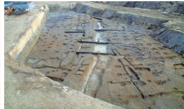
古墳時代の集落1

上私部遺跡は、第二京阪道路建設に伴う試掘で発見されました。その後、大阪府文化財センターにより発掘調査が実施され、5世紀初頭～7世紀前半の200年以上長期存続した古墳時代中期～後期の竪穴式住居52棟、掘立柱建物105棟もの跡が発見され、大集落であることが確認されました。