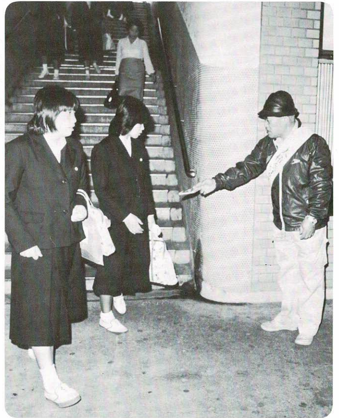
⇒ 駅前で人権啓発…憲法週間初日の5月1日、人権の共存、障害者の完全参加と平等などをうたった人権啓発を市内の駅前でおこないました。