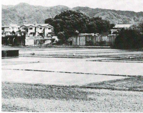
真中のこんもりしているのが丸山古墳

昔この古墳に立つて西側一杯に稲穂の波を眺めたことがあった。お米の神様の古墳かなと思