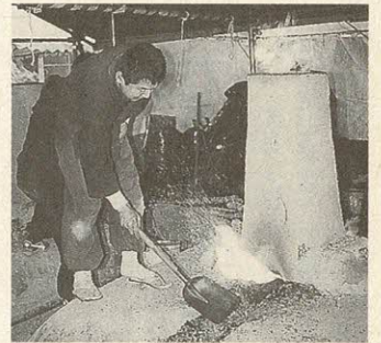
交野で再現 古代の鉄づくり「たたら」

○申し込み・問い合わせ 2月7日(土)までに、生涯スポーツ課(青年の家内 ☎92・7721)