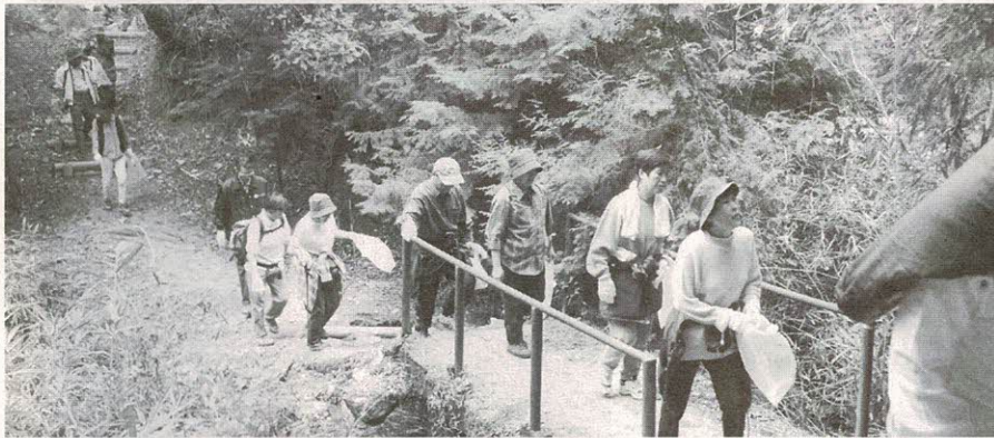
13年度のクリーニンググリーン作戦（倉治公民館～いきものふれあいセンター）