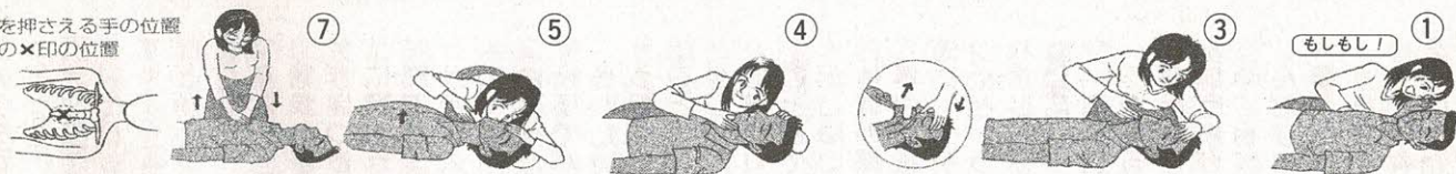
胸を押さえる手の位置 図の×印の位置