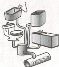
下水道排水設備指定工事店一覧表 (15年4月1日現在)