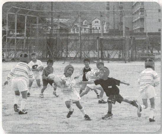
親子ふれあいタグラグビー