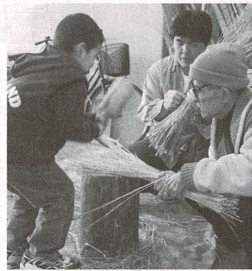
昨年(しめなわ)作り

(月)から電話か直接、福祉サービスク(ゆうゆうセンター)内 ☎893・6400) ※土曜・日曜日は受け付けていません。