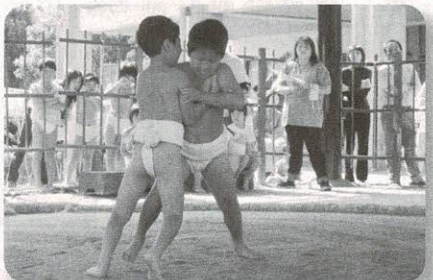
わんぱく相撲大会