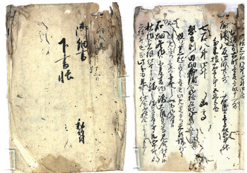
「御細帳下書帳」表紙

末尾3行目から「右畑冬作ハ小麦、夏作ハ綿大角豆等見合二仕申候、秋作ハ大根仕付申候」と記載されています。