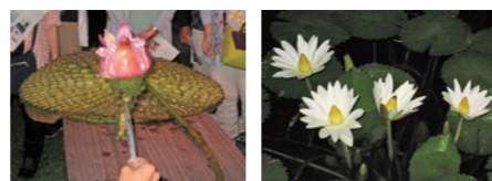
夜咲き熱帯スイレン観覧会