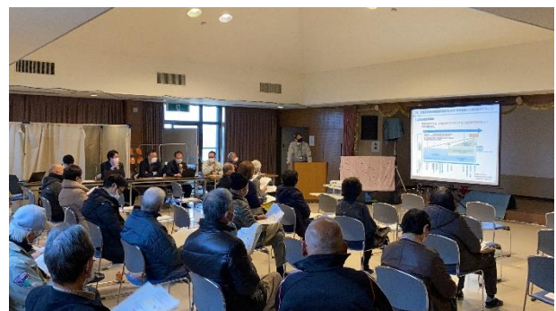
12月17日(土)の説明会の様子