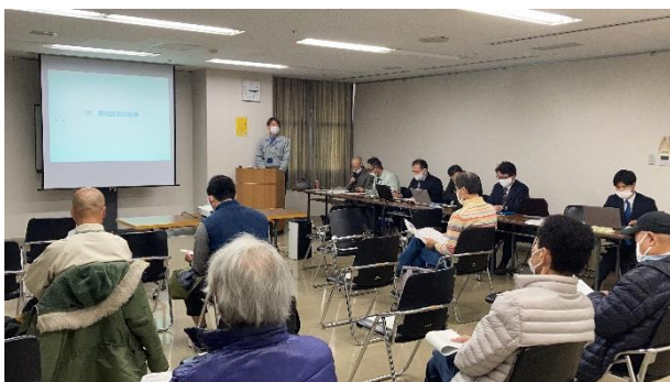
12月16日(金)の説明会の様子