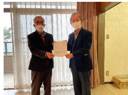
顧問就任依頼の様子