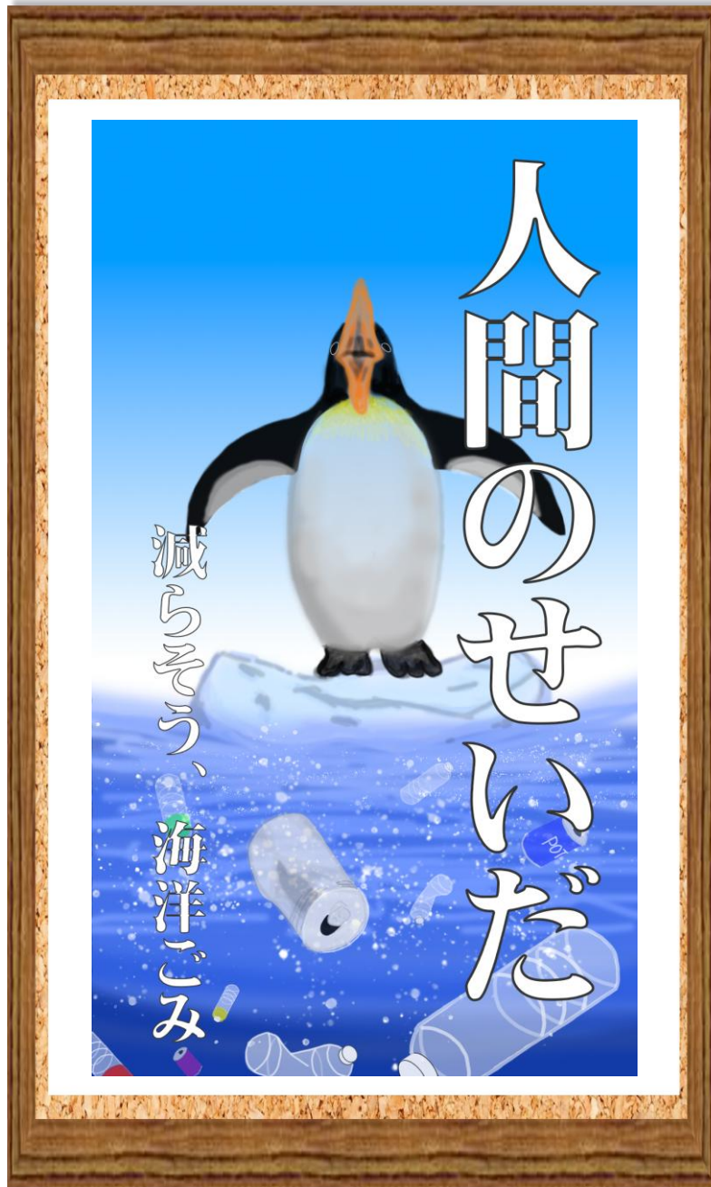
令和7年度「おおさか環境デジタルメディア学生コンテスト」最優秀賞