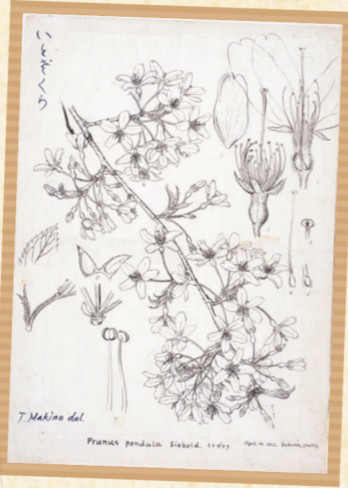
牧野富太郎肖像画・植物図

エドヒガン系統の園芸品種で、高さは20m以上になる落葉高木。すだねのように垂れ下がる姿が優美で、シダレザクラ(枝垂桜)とも呼ばれる。観賞用として古くから愛され、京都の「祇園しだれ桜」など日本各地に名木がある。個体により花色や花の大きさに変異が多く見られ、花が紅色のものを「ベニシダレ(紅枝垂)」、その八重咲きを「ヤエベニシダレ(八重紅枝垂)」という。