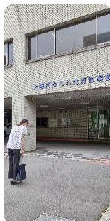
まい朝ルーティーン ♪よろしくおねがいします