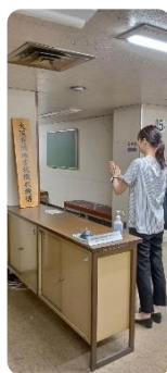
まい朝ルーティーン ♪本日もご安全に