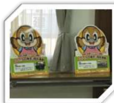
【もずやんの表彰パネル】