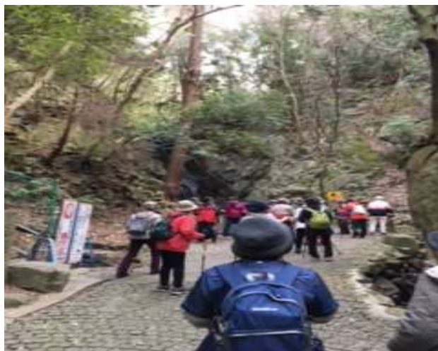
ノルディックウォークの様子