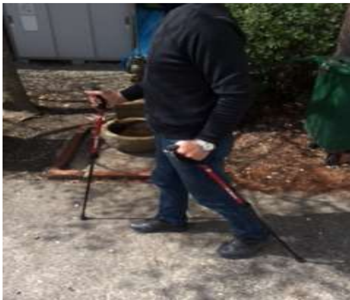
ノルディックポール