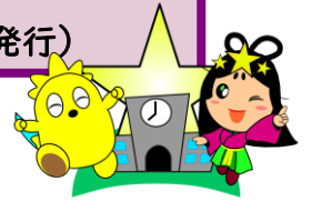
星のあまん おりひめちゃん