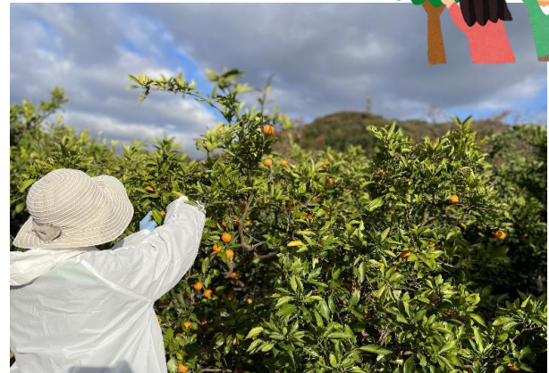
調理員さんが収穫してくれました