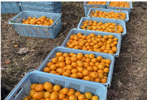
たくさん収穫できました