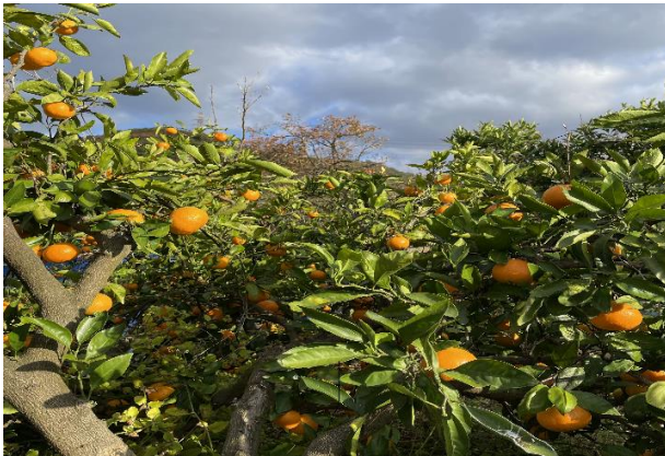
交野山の麓に広がる鮮やかなオレンジ色