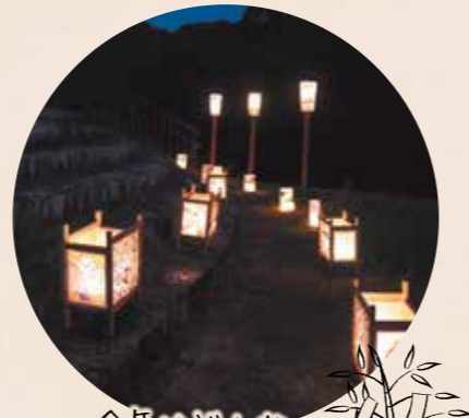
今年はどうな お願い事を しようかな