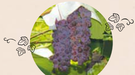
旬を味わえる ってしあわせ