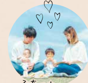
子育て家族が どんどん増えてます