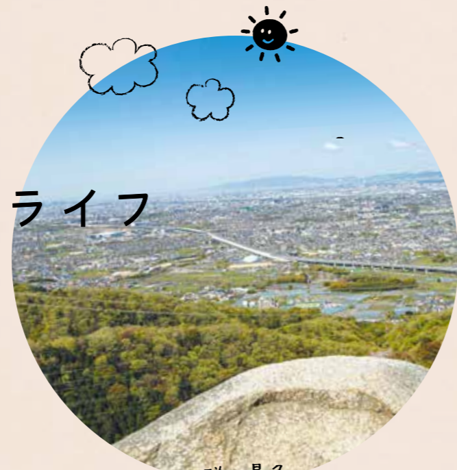
抜群の景色に 心も晴れる

大阪府の北東部に位置する交野市は、緑あふれる自然環境と都市の利便性を「いいところ」できるまち。星のブランコなど人気の行楽地スポットから身近な公園まで暮らしの中に緑が点在し、大阪、京都への交通アクセスも便利。それぞれの人に合った、充実の交野ライフがきっと見つかります。