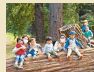
大阪公立大学附属植物園