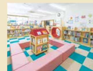
星田会館図書室(児童書コーナー)

トンネルベンチやおうち型の本棚もあってわくわく！倉治図書館や青年の家図書室もあります。