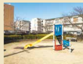
私部西1丁目ちびっこ広場