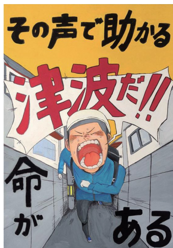
高校生・一般の部 香川県 英明高等学校 林 和花さん

お問い合わせ 〒171-0033 東京都豊島区高田3丁目6-7 ニュー野村マンション101号室 「第42回 防災ポスターコンクール事務局」 (株式会社シバムジーク内) 電話 03-6912-6151 受付時間 平日/午前 9:00～12:00 (土・日・祝日を除く) 午後 13:00～17:00